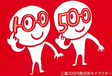
三鷹100円商店街キャラクター ひゃっくん & ごひゃっくん

お待たせしました!ついに再開、2年ぶりの100円商店街です。100円~ワンコインの商品は、各店によって様々。究極のグルメあり、掘り出し物あり、スタンプラリーの景品も充実!この日は同じエリアで「エコマルシェ」、「防災スタンプラリー」も開催され、盛り上がること間違いなし!