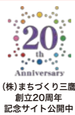
(株)まちづくり三鷹 創立20周年 記念サイト公開中