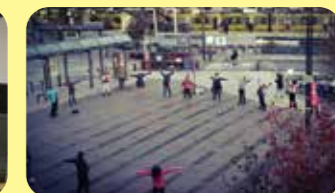
「冬の早朝 みたか駅前ラジオ体操」 (第23回三鷹まちづくりフォトコンテスト みたかフィルムコミッション賞受賞作品)