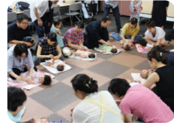
昨年のベビーデーの様子

今年は、7月29日(土)に「わくわくキッズデー」として、キッズが楽しめる、ものづくり体験や工作、30日(日)は、「のびのびベビーデー」として、3歳ぐらいまでのお子さんをお持ちのファミリー向けの楽しい企画や映画上映が行われます。詳しくは、7月上旬に公開されるまるごと夏まつりのHPをご覧ください。