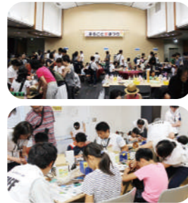
昨年のキッズデーの様子