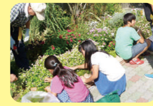
一小的栽培委員と一緒に花の植え替え中