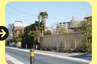
整備後の道路は、歩道が広く快適！

り強く周辺住民に説明し、大多数の方の賛同を得て、平成23年に着工、翌年に完成しました。公募によって親しみのある新名称も決定。「歩道が広がって、子どもたちが安心して登校できるようになりました」と喜んでいます。