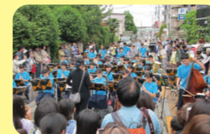
六中の吹奏楽には、こんなに大勢の観客が！