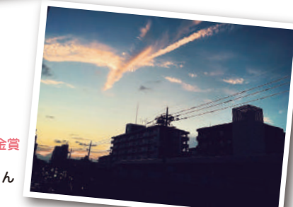
U18部門 金賞 「phoenix」 田口 千裕さん