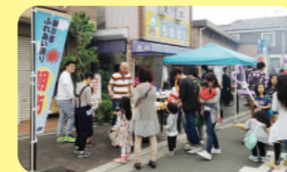
大にぎわいの朝市はふれあいの場です

取材を通じ、地域の方が一丸となって、子どもたちをはじめ、地域を守っている姿に感動しました。地域は、そこに住む人々によって作られていることをあらためて感じる事ができました。