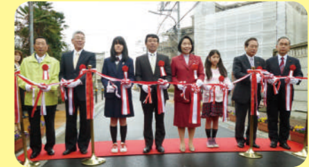
2011年3月24日、「新川宿ふれあい通り」完成記念式典を協議会と三鷹市の共催で行いました。

相互通行を一方通行にし、歩道を広く、と協議会で意見が一致。協議会役員が個別訪問をするなど道路改修の目的を粘