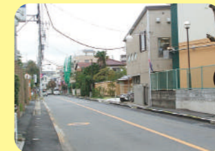
整備前の道路は、歩道が狭く、段差もあります。