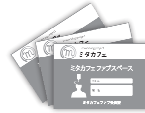
※デザインは変更になる場合があります

3Dプリンターなどの基礎的なデジタルツールを配備した、ものづくりによるコミュニティづくりのためのスペース「ミタカフェ ファブスペース」を三鷹産業プラザ3階に5月1日よりオープンしました。