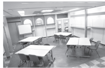
にぎわいコーナーA