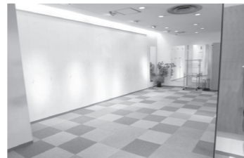
にぎわいコーナーB